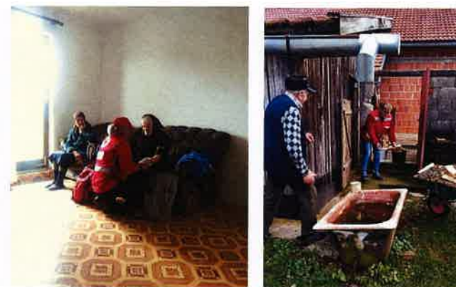
Pomoć u kući starijim osobama