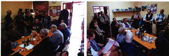
Obilježavanje dana žena