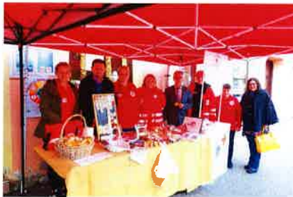
Obilježavanje Međunarodnog dana starijih osoba i Svjetskog dana srca