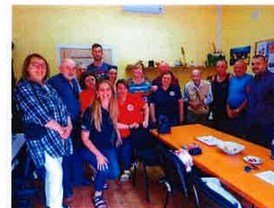
Posjet delegacije Službe traženja HCK i BIH

Dana 19.06.2019. u cilju što bolje suradnje u kriznim situacijama, uugostiti smo delegaciju Službe traženja iz Bosne i Hercegovine i Hrvatskog Crvenog križa te im prezentirali rad Hrvatskog Crvenog križa Gradskog društva Crvenog križa Slunj. Nakon posjete u Slunju uputili smo se u Korenicu gdje je održan sastanak s ravnateljicom HCK GDCK Plitvička Jezera po pitanju službe traženja i migracija.