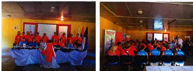
Uvodna konferencija projekta Oživi žene u zajednici

U cilju predstavljanja projekta Oživi žene u zajednici, 30.07.2019. godine održana je uvodna konferencija.