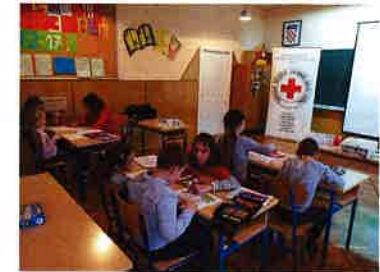
Radionica Kako prati ruke i obnovljivi izvori energije