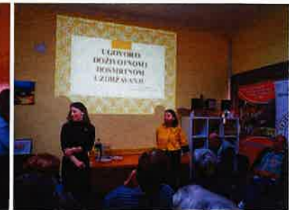
Predavanje Ugovor o doživotnom / dosmrtnom uzdržavanju