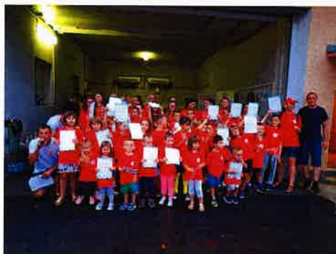
Sportski ujedinjeni u zdravlju

Dana 02.08.2019. godine u prostorijama DVD-a Slunje održali smo osmu po redu manifestaciju za najmlađe pod nazivom Sportski ujedinjeni u zdravlju. Tom prigodom okupili su se sportski klubovi i udruge s područja grada Slunja: Gradsko društvo Crvenog križa Slunje, DVD Slunje, KBK Tigar, NK Slunje, Rukometni klub Drenak i Policijska postaja Slunje sa ciljem da djeci ukažu na aktivnije bavljenje sportom radi zdravijeg načina života od najmanje dobi.