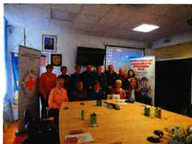
Međunarodni dan volontera

Dana 05.12.2019. godine u organizaciji Gradskog društva Crvenog križa Slunj obilježen je Međunarodni dan volontera u gradskoj vijećnici na prijemu kod gradonačelnika grada Slunja. Deset volontera sa najvećim brojem volonterskih sati nagrađeno je slikom, plaketom te im je uručena zahvalnica.