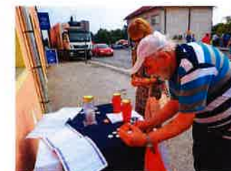
Obilježavanje dana nestalih osoba