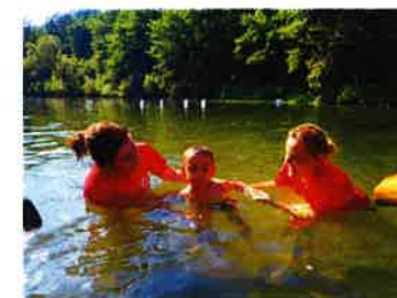
Sigurnost na vodi – škola plivanja