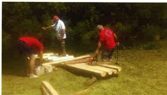
Volonteri uređuju kupalište za školu plivanja

Dana 05.12.2019. godine u organizaciji Gradskog društva Crvenog križa Slunj obilježen je Međunarodni dan volontera u gradskoj vijećnici na prijemu kod gradonačelnika grada Slunja. Deset volontera sa najvećim brojem volonterskih sati nagrađeno je slikom, plaketom te im je uručena zahvalnica.