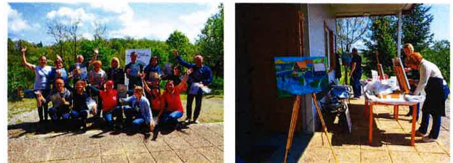
Likovna kolonija Crvenog križa Slunj 01.05.2019.