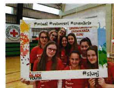
Obilježavanje Tjedna Crvenog križa, 9.5.2019.