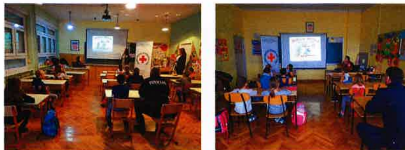
Radionica „Mišica Milica“

ne govore svoje ime, prezime, adresu ili u koju školu idu, što učiniti ako se izgube ili ih netko pokuša odvesti na silu te da je važno znati broj policije. Radionicu smo proveli u OŠ Slunj, Cetingrad i Eugen Kvaternik Rakovica gdje je sudjelovalo ukupno 49 učenika. Nakon edukacije slijedilo je druženje uz zanimljive igre, a nakon druženja svatko dijete je dobilo slikovnicu „Mišica Milica“ na poklon.