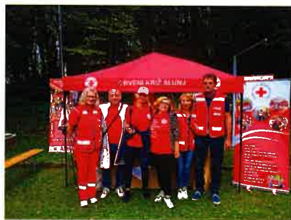
Obilježavanje Svjetskog dana prve pomoći u Ogulinu