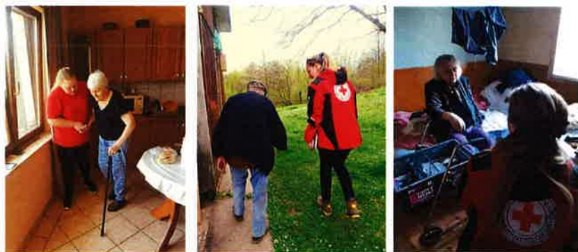
Obilazak korisnika u sklopu projekta Zaželi

Na dan 31.12.2019. u projekt Zaželi – oživi žene u zajednici uključeno je 92 korisnika što je znatno veći broj od planiranog, ali je pokazatelj potreba na terenu.