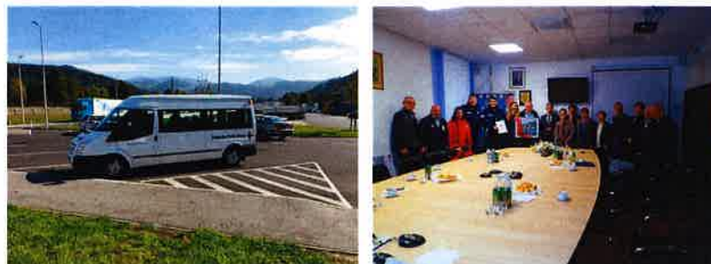
Međunarodna suradnja s Deutsche Rote Kreuz Emden

gradonačelnika grada Slunja. Kombi vozilo će služiti za rad i aktivnosti Gradskog društva Crvenog križa Slunj.