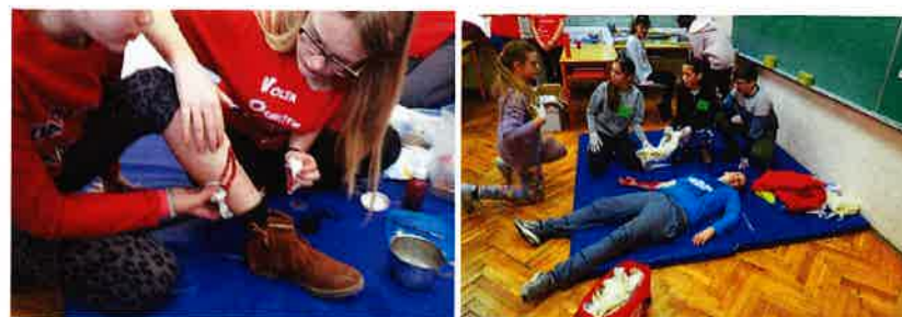
Natjecanje mladih Crvenog križa Slunj