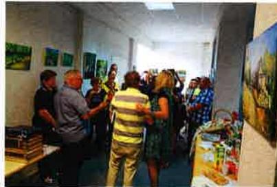
Izložba radova likovne kolonije „Poezija u srcu“