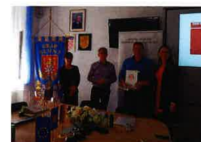
Dodjela priznanja povodom Dana darivatelja krvi

Dana 25.10.2019. godine naši "najmlađi" darivaoci krvi koji su tijekom 2019. godine prvi puta darovali krv sudjelovali su na svečanom prijemu i druženju sa županom Karlovačke županije koji je pod organizacijom Društva Crvenog križa Karlovačke županije bio upriličen u Muzeju Domovinskog rata.