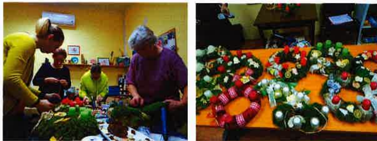
Radionica u Rekreativnom kutku