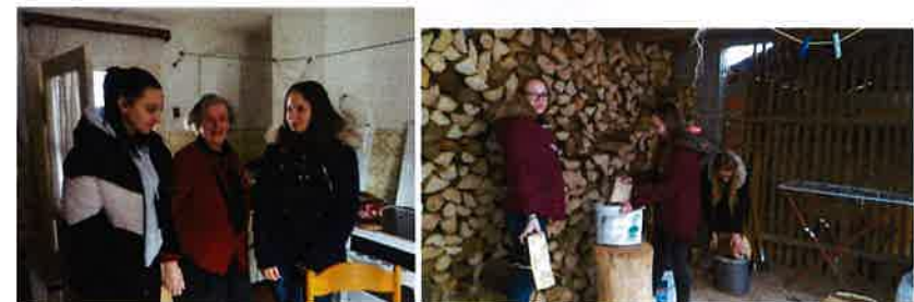
Pomoć u kući – volonteri učenici Srednje škole Slunj

Volonteri se uključuju po potrebi u različitim aktivnostima – radionice u Rekreativnom kutku, u školama, rad s djecom i mladima, obilježavanje prigodnih datuma. Primjer dobre prakse Srednje škole Slunj je uključivanje učenika Srednje škole u program Pomoć u kući starijim osobama u sklopu kojega su odvojili svoje vrijeme i s našim radnicima posjetili starije osobe na našem području.