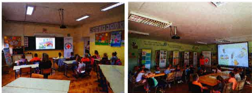
Radionica Sigurnost u prometu

Gradsko društvo Crvenog križa Slunj i Policijska postaja Slunj na početku školske godine provode radionice u prvim razredima Osnovnih škola Slunj, Eugen Kvaternik Rakovica i Cetingrad. Tako je i na početku školske godine 2019. godine, dana 17.09. 19.09. i 20.09. uz pomoć volontera Crvenog križa Slunj održano predavanje i zanimljiva radionica u kojoj su se djeci pokazale osnove pravilnog ponašanja u prometu, a na kraju je svatko dobio kišnu kabanicu i slikovnicu "Na putu do škole"! Na radionici je sudjelovalo 47 prvšaća.