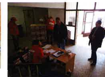
Podjela humanitarne pomoći FEAD paketa