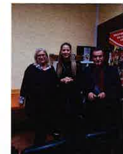
Predavanje „Kronične komplikacije šećerne bolesti – dijabetičko stopalo“,