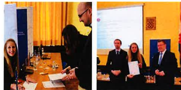
Potpisivanje ugovora za projekt Zaželi

Hrvatski Crveni križ Gradsko društvo Crvenog križa Slunj preuzeo je ugovor dana 22.02.2019. u Zadru, a potpisan je 01.03.2019. godine.