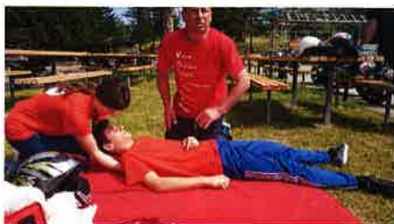
Pokazna vježba pružanje prve pomoći

Važan dio programa rada s Mladeži Crvenog križa Slunj je zdravstveno prosvjeđivanje pri čemu naglasak stavljam na pružanje prve pomoći, a stečena znanja i vještine mladi provjeravaju na natjecanjima i demonstriraju na pokaznim vježbama.