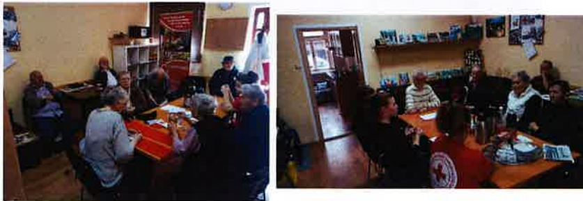
Predavanja i svakodnevno druženje u rekreativnom kutku