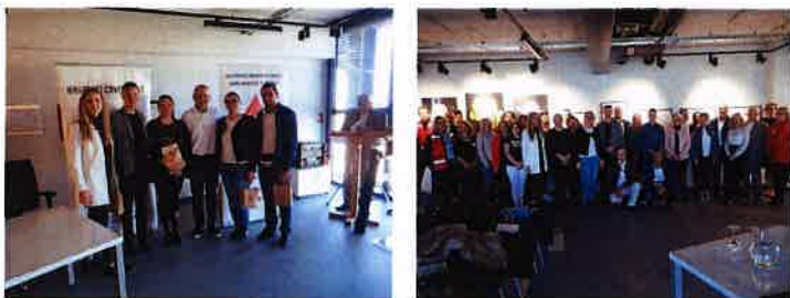
Prijem za darivatelje pod organizacijom Društva Crvenog križa Karlovačke županije