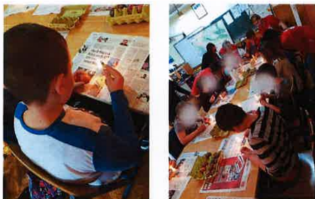
Radionica s djecom pisanje pisanica