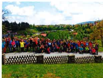
Festival Nordijskog hodanja 01.05.2019.