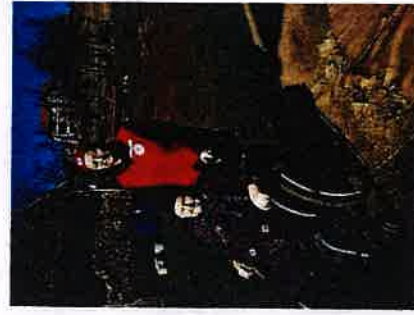
Obilazak korisnika u sklopu projekta Zaželi

14. Projekt Mobilnost osoba treće životne dobi na području Slunja, Cetingrada i Rakovice Gradsko društvo Crvenog križa Slunj od 01. prosinca 2019. godine provodi projekt pod nazivom Mobilnost osoba treće životne dobi na području Slunja, Cetingrada i Rakovice. Projekt je usmjeren unapređenju kvalitete života i zaštiti prava starijih osoba te se provodi u suradnji sa Ministarstvom za demografiju, obitelj, mlade i socijalnu politiku.