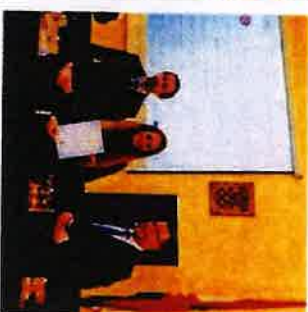
Poljskivanje ugovora za projekat Zaželi

Ukupna vrijednost projekta je 2.317.905,00 kn u sklopu kojega se zaposlilo 9 žena koje su u nepovoljnom položaju na tržištu rada, a koje će se skrbiti o minimalno 36 starijih osoba i osoba u nepovoljnom položaju.