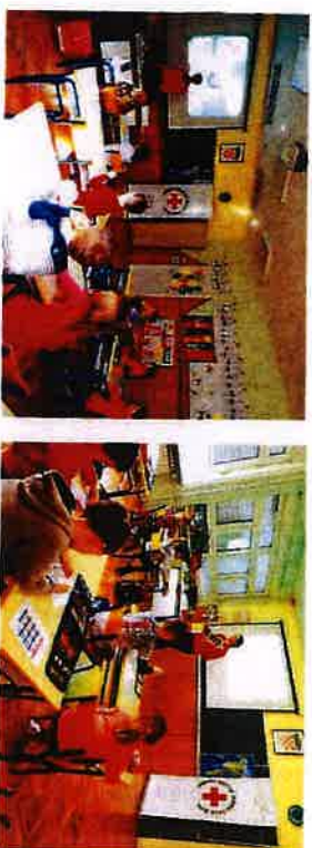
Radionica Kako prati ruke i obnovljivi izvori energije

Povodom dana zdravlja (07.04.) i Dana planete zemlje (22.04.) održan je ciklus predavanja i radionice "Kako prati ruke-zube i obnovljivi izvori energije" u suradnji s Osnovnom školom Slunji, Osnovnom školom Eugen Kvaternik Rakovica i Osnovnom školom Četingrad za djecu iz I. razreda. Naši najmlađi su naučili koji je postupak pranja ruku i kada ih treba prati, isto tako su na zanimljiv način vidjeli da kružni pokretima peremo zube kako ne bi imali "griča" i "griča". I na taj način brinu o svom zdravlju i higijeni. A kako bi zaštitili planetu zemlju ne smijemo bacati otpad i bazirati se na obnovljive izvore energije kao što su solarne ploče. Na radionicama je ukupno sudjelovalo 41 djece.