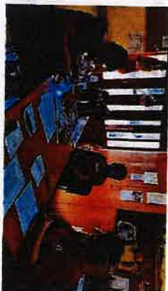
Svakodnevno druženje u Rekreativnom kutku