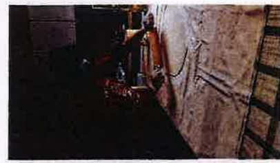
Obilazak korisnika u tijeku pandemije bolesti Covid 19