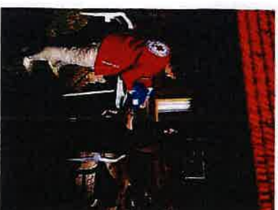
Podjela donacije od Ministarstva poljoprivrede

Sve navedene i zaprimljene donacije su podijeljene socijalno ugroženim osobama i osobama u potrebi na području grada Slunja, općina Četina grad i Rakovica.