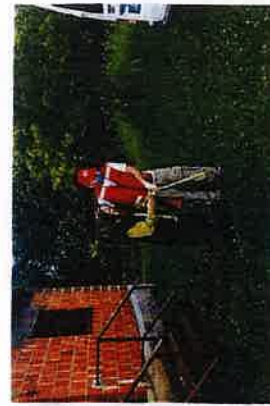
Projekt Mobilnost osoba treće životne dobi na području Slunja, Cetingrada i Rakovice