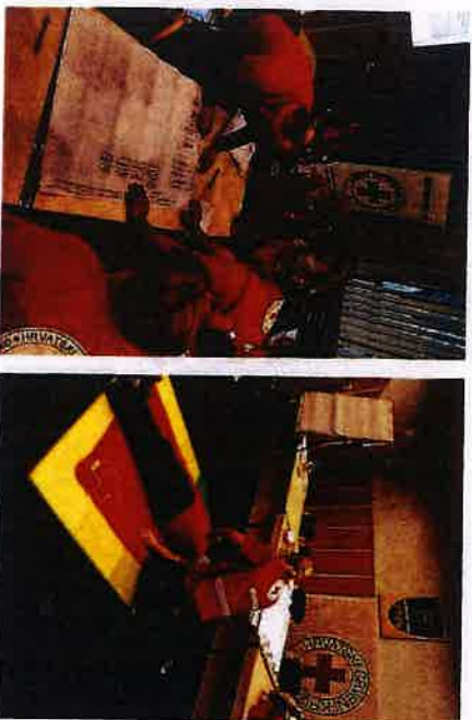
Edukacija za članove interventnog tima

27.01.2020. i 28.01.2020. godine u Stubičkim Toplicama organizirana je edukacija za članove interventnog tima sa ciljem osnaživanja Županijskog interventnog tima na kojoj je sudjelovalo 12 djelatnika i volontera Gradskog društva Crvenog križa Slunji. Neke od tema koje su bile obuhvaćene edukacijom su: podizanje naselja za korisnike u kriznim situacijama, edukacija prve pomoći, profesionalni stres, kako raditi s djecom u kriznim situacijama.