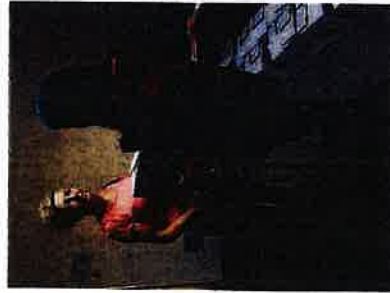
Podjela paketa „Vaš dar za pravu stvar“

Hrvatski Crveni križ organizirao je tijekom lipnja 2020. godine pomoć osobama koje su ostale bez posla zbog krize izazvane pandemijom koronavirusa (COVID-19) u Hrvatskoj paketima hrane „Vaš dar za pravu stvar“. Gradsko društvo Crvenog križa Slunji zaprimilo je 28 paketa koji su potom podijeljeni nezaposlenim osobama prema popisu koji je zaprimljen od strane Hrvatskog zavoda za zapošljavanje.