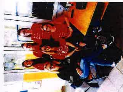
Volonterke na Gradskom najječanju Crvenog križa

Gradsko društvo Crvenog križa Slunj posebnu pažnju posvećuje volonterima i volonterkim akcijama. U izvještajnom razdoblju od 01.01.-30.06.2020. godine ukupno 29 volontera otkradila su 323 sata volontiranja. Volonteri se uključuju po potrebi u različitim aktivnostima – radionice u Rekreativnom kutku, u školama, rad s djecom i mladima, obilježavanje prigodnih datuma.