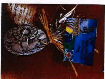
Podjela poklona povodom Uskrsa