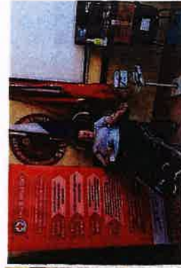
Akcije dobrovoljnog darivanja krvi