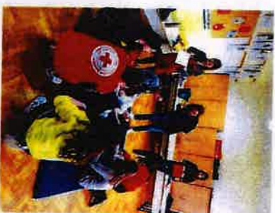
Natjecanje mladih Crvenog križa Slunji u Cetingradu