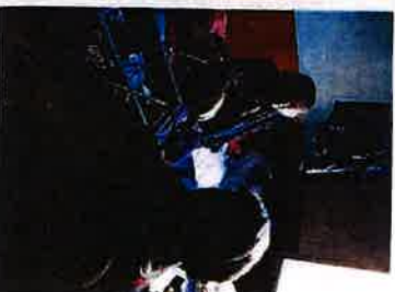
Obilazak korisnika u sklopu projekta Zaželi