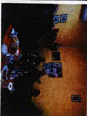
Obilježavanje dana žena