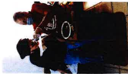
Pomoć u kući starijim osobama