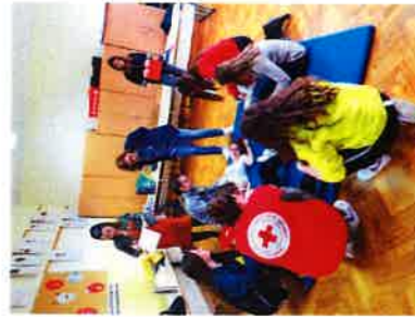
Natjecanje mladih Crvenog križa Slunji u Cetingradu