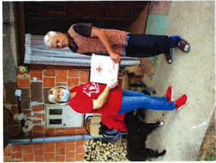
Podjela paketa „Vaš dar za pravu stvar“

48. sabirna akcija "Solidarnost na djelu 2020. godine" kao zajednička akcija svih društava Hrvatskog Crvenog križa provela se 08. listopada 2020. godine. Djelatnici, volonteri i korisnici Crvenog križa Slunj i ove godine ispred Rekreativnog kutka Dodajmo život godinama za starije osobe su dijelili bonove s oznakom vrijednosti 1,00 kn i prikupljali dobrovoljna sredstva za one kojima je pomoć najpotrebnija. Akcija se provodila pod sloganom "Ne dvoji! Za drugog izdvoji!" Također u akciju su se uključili i Osnovna škola Slunj, Četinaševac, Eugen Kvaternik Rakovica, Srednja škola Slunj i Dječji vrtić Slunj.