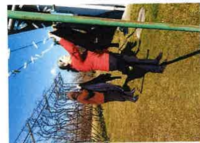
Obilazak korisnika u sklopu projekta Zažeti