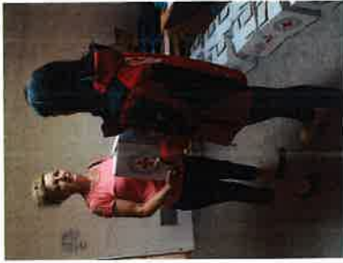
Podjela paketa „Vaš dar za pravu stvar“

Hrvatski Crveni križ organizirao je tijekom lipnja 2020. godine pomoć osobama koje su ostale bez posla zbog krize izazvane pandemijom koronavirusa (COVID-19) u Hrvatskoj paketima hrane „Vaš dar za pravu stvar“. Gradsko društvo Crvenog križa Slunj zaprimilo je 28 paketa koji su potom podijeljeni nezaposlenim osobama prema popisu koji je zaprimljen od strane Hrvatskog zavoda za zapošljavanje.