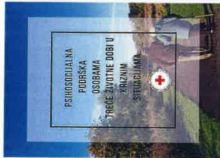
Brošure u sklopu aktivnosti Rekreativnog kutka