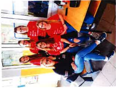
Volonterke na Gradskom natjecanju Crvenog križa

Gradsko društvo Crvenog križa Slunjski posebnu pažnju posvećuje volonterima i volonterским akcijama. U izvještajnom razdoblju od 01.01.-31.12.2020. godine ukupno 52 volontera odradila su 913,5 sata volontiranja. Volonteri se uključuju po potrebi u različitim aktivnostima – radionice u Rekreativnom kutku, u školama, rad s djecom i mladima, obilježavanje prigodnih datuma