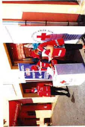
Obilježavanje Svjetskog dana prve pomoći uz sudjelovanje volontera

U obilježavanju Svjetskog dana prve pomoći, 10. rujna 2020. godine sudjelovali su i volonteri Gradskog društva Crvenog križa Slunjski povodom manifestacije "Hrvatska volontira" te na taj način još jednom istaknuli kako volontiranje stvara priliku za povezivanje i poboljšavanje odnosa u zajednici.