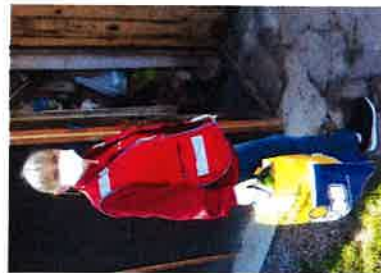
Dostava lijekova i namirnica tijekom pandemije bolesti Covid 19

U cilju pomoći starijim osobama, ali i ostalim građanima koji su trenucima pojave pandemije bolesti COVID 19 osjetili zabrinutost i strah, u suradnji sa Ašjom Dubravčić, mag.log., mag.reh. i socijalnom radnicom Sandrom Lovrić Rupčić kroz aktivnosti Rekreativnog kutka Dodajmo život godinama, podijelili smo korisnicima Rekreativnog kutka brošure sa temama u cilju pružanja psihosocijalne podrške te smo iste objavili na Facebook stranici i službenoj web stranici kako bismo brošure učinili dostupnima svima kojima je bila potrebna psihosocijalna podrška u tim trenucima.