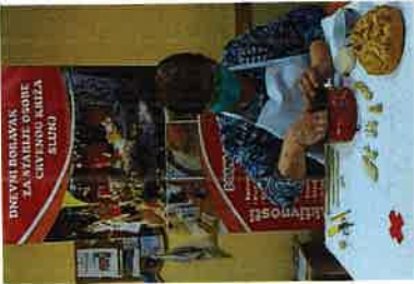
Tradicionalna izrada božićnjaka