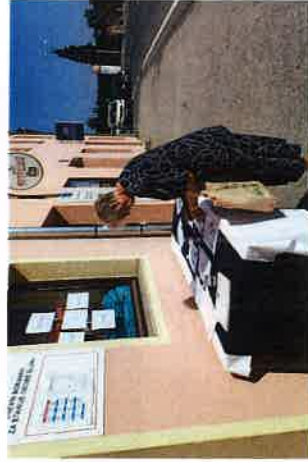
Obilježavanje Međunarodnog dana nestalih osoba u RH