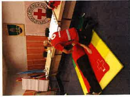
Edukacija za članove interventnog tima