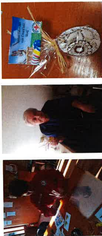
Podjela poklona povodom Uskrsa