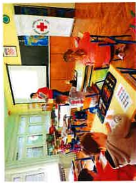
Radionica Kako prati ruke i obnovljivi izvori energije