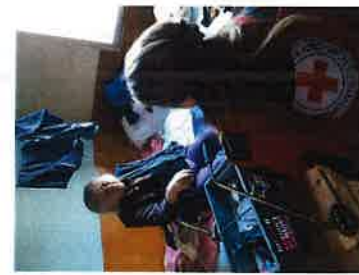
Obilazak korisnika u sklopu projekta Zaželi