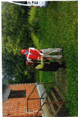
Projekt Mobilnost osoba treće životne dobi na području Slunja, Cetingrada i Rakovice

Gradsko društvo Crvenog križa Slunj prijavilo je istoimenu projekt u listopadu 2020. godine nastavno na Poziv za prijavu dvogodišnjih programa usmjerenih unapređenju kvalitete života i zaštiti prava starijih osoba za 2021. i 2022. godinu. Navedeni projekt je dobiven te počinje sa provedbom od 01. siječnja 2021. godine.