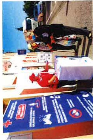
Obilježavanje Svjetskog dana prve pomoći