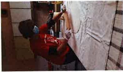
Obilazak korisnika u tijeku pandemije bolesti Covid 19

Uslijed pojave koronavirusa u Republici Hrvatskoj, Gradsko društvo Crvenog križa Slunj na Facebook stranici i službenoj web stranici objavilo je kontakt broj 047 777 204 te svi građani koji su u bili u samoizolaciji ili karanteni, svi koji su osjećali zabrinutost u vezi situacije s epidemijom koronavirusa te im je bila potrebna psihosocijalna pomoć, pozivali su na kontakt telefon. Na navedeni kontakt broj, pružena je mogućnost i da se javu sve osobe u potrebi i osobe u samoizolaciji koje nisu bile u mogućnosti odlaziti u kupovinu i nabavu osnovnih namirnica, lijekova.