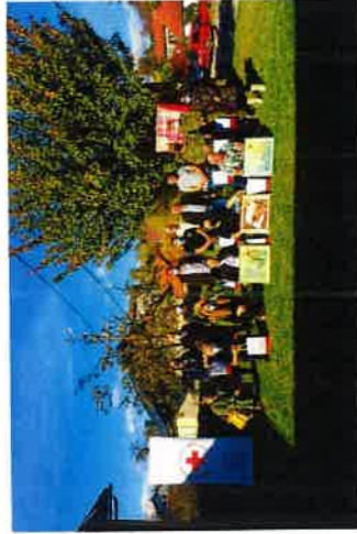
Prijem darivatelja krvi 22.10.2020.