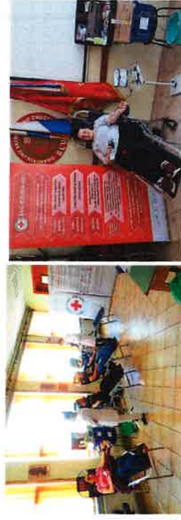
Akcije dobrovoljnog darivanja krvi

14.06.2019. u RH se obilježava Svjetski dan darivatelja krvi. Za razliku od dosadašnjih godina kada je Gradsko društvo Crvenog križa Slunji organiziralo izlet za darivatelje krvi povodom Svjetskog dana darivatelja krvi, ove godine zbog loše epidemiološke situacije uzrokovane pandemijom bolesti COVID 19, izlet za darivatelje je otkazan.