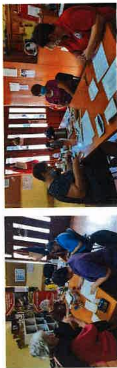
Svakodnevno druženje u Rekreativnom kutku