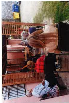
Predavanje na temu „Recikliranje otpada“