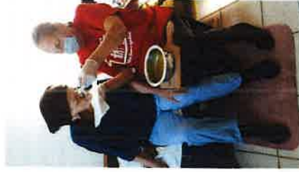
Pomoć u kući starijim osobama