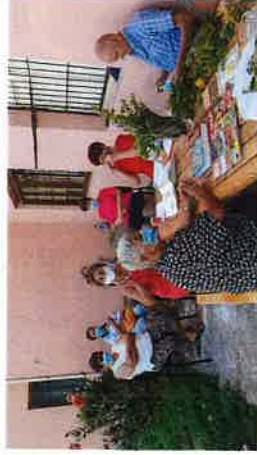
Radionica o ljekovitom bilju