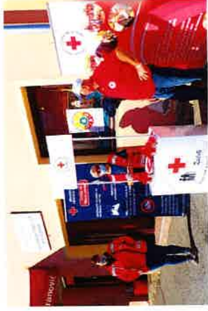
48. sabirna akcija "Solidarnost na djelu 2020. godine"

48. sabirna akcija "Solidarnost na djelu 2020. godine" kao zajednička akcija svih društava Hrvatskog Crvenog križa provela se 08. listopada 2020. godine. Djelatnici, volonteri i korisnici Crvenog križa Slunj i ove godine ispred Rekreativnog kutka Dodajmo život godinama za starije osobe su dijelili bonove s oznakom vrijednosti 1,00 kn i prikupljali dobrovoljna sredstva za one kojima je pomoć najpotrebnija. Akcija se provodila pod sloganom "Ne dvoji! Za drugog izdvoji!" Također u akciju su se uključili i Osnovna škola Slunj, Četinaševac, Eugen Kvaternik Rakovica, Srednja škola Slunj i Dječji vrtić Slunj.