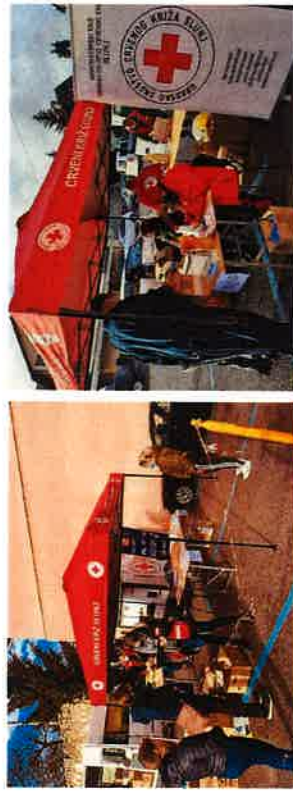
Prikupljanje paketa humanitarne pomoći za stradale u potresu

Potres magnitude 5 u ponedjeljak, 28. prosinca 2020. godine te magnitude 6,2 po Richtеровој ljestvici u utorak, 29. prosinca 2020. godine, pogodio je Sisačko-moslavačku županiju s epicentrom 3 km jugozapadno od grada Petrinje. Gradsko društvo Crvenog križa Slunji sudjelovalo je u apelu Hrvatskog Crvenog križa u prikupljanju pomoći stradalim u potresu na području Petrinje, Gline, Siska i okolnih sela. Krajem 2020. godine te početkom 2021. godine, GDCK Slunji s volonterima je prikupio 1600kg hrane, higijene i zaštitne opreme za pomoć osobama stradalima u potresu koje su donirali građani.