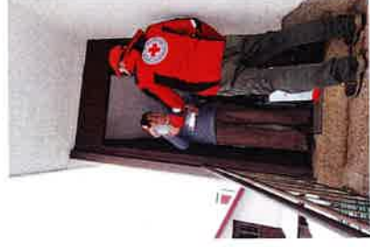
Podjela paketa u sklopu projekta "Čuvajmo ih"

Projekt "Čuvajmo ih" - Zajedno zaštitimo naše starije od strane Hrvatskog Crvenog križa, omogućilo je podjelu osobne zaštitne opreme, s ciljem smanjenja rizika od zaraze koronavirusom osiguravanjem paketa osobne zaštitne opreme za starije osobe slabijeg socio-ekonomskog statusa. Korisnici koji su obuhvaćeni ovom podjelom su: korisnici usluge Pomoć u kući stariji od 65 godina, korisnici paketa FEAD stariji od 65 godina te korisnici drugih socijalno-humanitarnih programa stariji od 65 godina. U sklopu ovog projekta podijeljeno je 189 paketa osobne zaštitne opreme (zaštitne maske i dezinfekcijsko sredstvo).