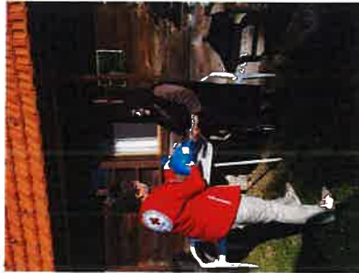
Podjela donacije od Ministarstva poljoprivrede

Sve navedene i zaprimljene donacije su podijeljene ugroženim osobama i osobama u potrebi na području grada Slunja, općina Cetingrad i Rakovica.