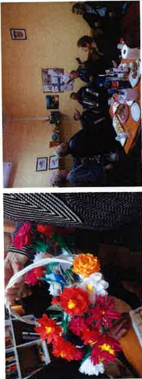
Obilježavanje dana žena