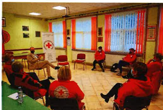
Edukacija djelatnika 25.10.2021.