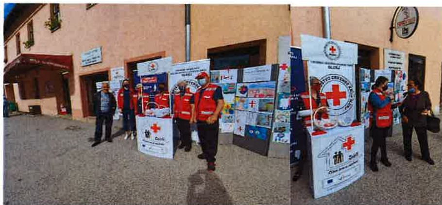
Tjedan Crvenog križa – 08.05.-15.05.21.

Eugen Kavternik Rakovica te Dječji vrtić Slunj i Drežničko selište. Građanima su podijeljeni promotivni materijali projekta Zaželi-Oživi žene u zajednici. Sve aktivnosti koje pruža Gradsko društvo Crvenog križa Slunj su svakodnevno objavljivane na facebook stranici s likovnim uradcima djece.