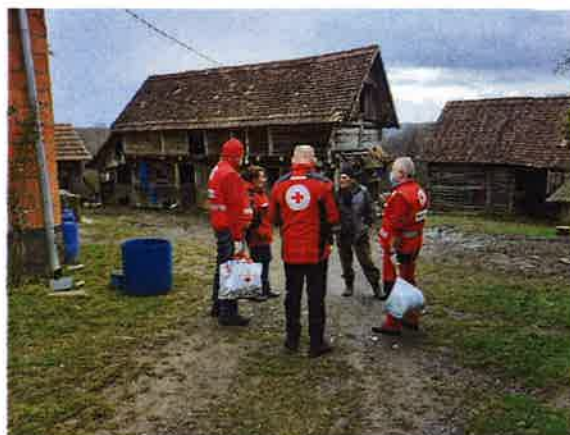
Podjela paketa hrane, higijene i vode osobama stradalim u potresu na području Sisačko-Moslavačke županije