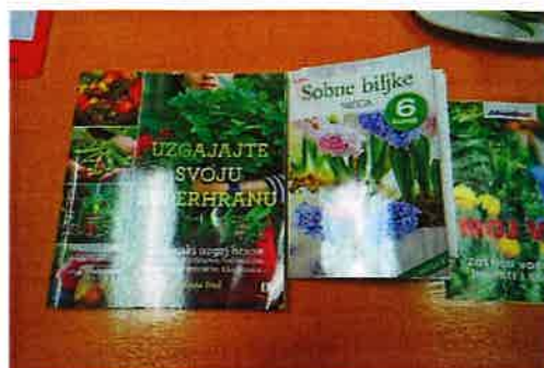
Predavanje o vrtlarenju 27.04.2021.