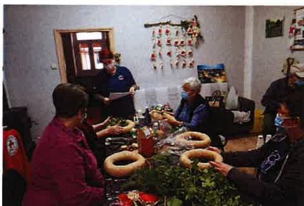
Radionica izrade adventskih vijenaca