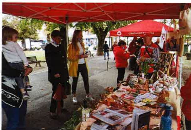
Obilježavanje dana starijih osoba i dana srca