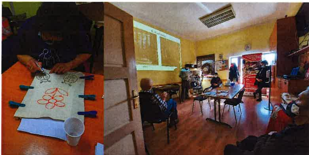
Radionica oslikavanje torbi 29.04.21.