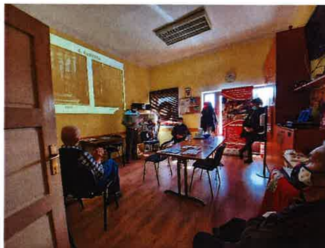
Predavanje povodom Dana planete zemlje 21.04.21.

Kroz video su navedene razne činjenice vezane uz klimatske promjene te su prikazana pozitivna ponašanja kojima svatko može doprinijeti pozitivnoj promjeni. Video link: https://fb.watch/6-nU_pkfkz/ (na 1:19h počinje prilog GDCK Slunjsko)