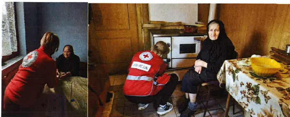
Obilazak korisnika programa Pomoć u kući