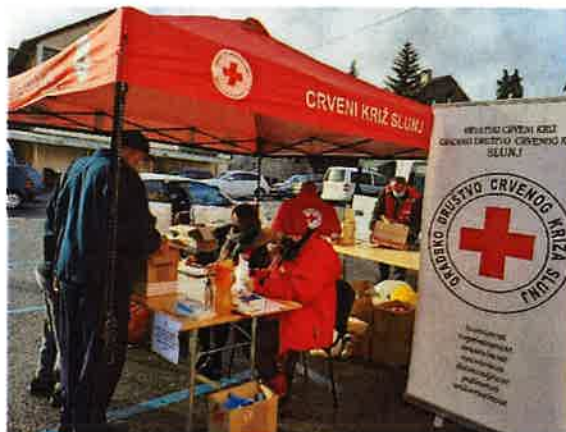
Volonteri – prikupljanje donacija za osobe stradale u potresu na području Sisačko-Moslavačke županije