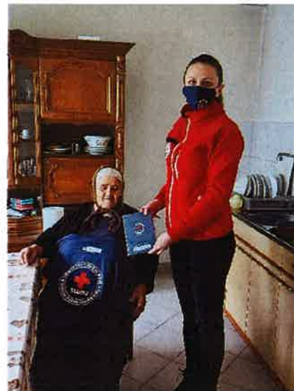
Podjela promotivnog materijala krajnjim korisnicima projekta Zaželi-Oživi žene u zajednici