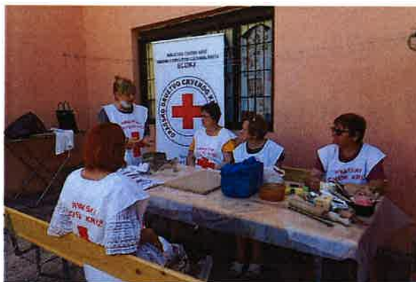
Radionica izrade suvenira