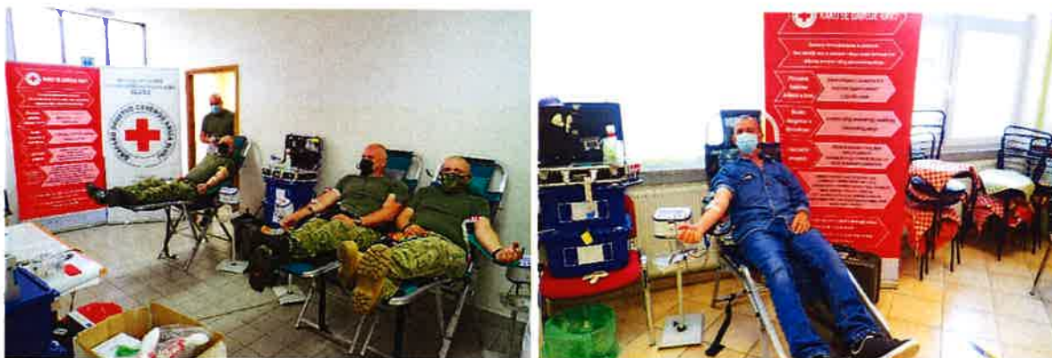
Akcija dobrovoljnog darivanja krvi u na Vojnom Poligonu Eugen Kvaternik Slunj i u gradu Slunju (DVD Slunj)

14.06.2021. u RH se obilježava Svjetski dan darivatelja krvi. Za razliku od dosadašnjih godina kada je Gradsko društvo Crvenog križa Slunj organiziralo izlet za darivatelje krvi povodom Svjetskog dana darivatelja krvi, ove godine zbog loše epidemiološke situacije uzrokovane pandemijom bolesti COVID 19, izlet za darivatelje je otkazan. Međutim na akciji 11.06.21. na Vojnom poligonu su se povodom Svjetskog dana darivatelja krvi dijelile prikladne majice i kemijske olovke. Taj dan je i medijski popraćen na način da se izradila čestitka za objavu na facebook stranici Crvenog križa Slunj.