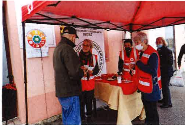
49. akcija Solidarnost na djelu

dijeliti bonove s oznakom vrijednosti 1,00kn i prikupljati dobrovoljna sredstva za one kojima je pomoć najpotrebnija. Akcija se provodila pod sloganom "Ne dvoji! Za drugog izdvoji!" Također u akciju su se uključili i Osnovna škola Slunj, Cetingrad, Eugen Kvaternik Rakovica, Srednja škola Slunj i Dječji vrtić Slunj. Navedena sredstva su utrošena za kupovinu paketa hrane koji su potom podijeljeni osobama u potrebi.