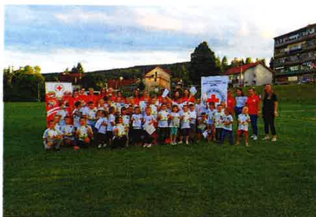
Sportski ujedinjeni u zdravlju