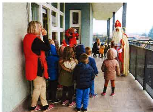
Sveti Nikola 6.12.