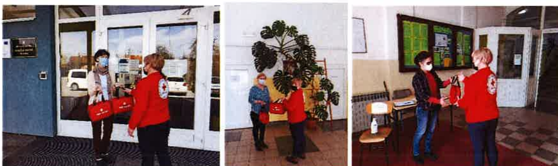
Podjela torbica prve pomoći

Sigurnije škole i vrtići je projekt Erasmus + Sigurnije škole i vrtići kojeg provodi Hrvatski Crveni križ u partnerstvu s nacionalnim društvima Crvenog križa Austrije, Bugarske, Sjeverne Makedonije, Srbije i Austrijskim Crvenim križem mladih. U sklopu projekta izrađena je platforma sigurnija-djeca.hck.hr za sigurnije i dobro pripremljene škole i vrtiće. Na platformi su dostupne različite aktivnosti, prezentacije, radionice, alati i pozadinske informacije iz prethodno navedenih područja. Gradsko društvo Crvenog križa Slunja je u sklopu projekta školama i vrtićima na području grada Slunja, općina Cetingrad i Rakovica podijelio torbice prve pomoći s kojima ima uspješnu dugogodišnju suradnju.