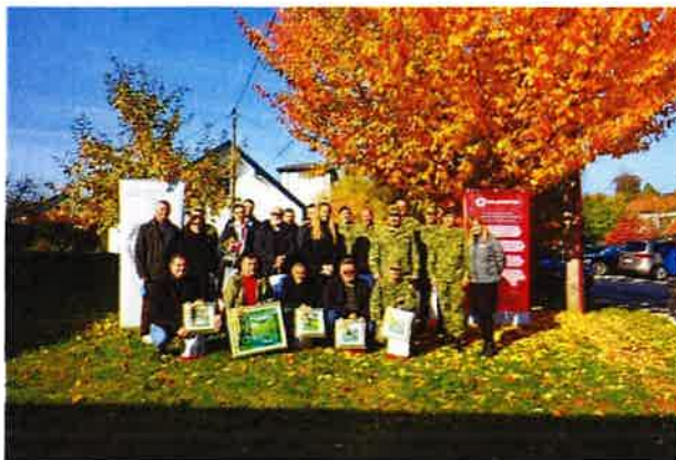
Podjela zahvalnica povodom Dana darivatelja krvi

Povodom Dana dobrovoljnih darivatelja krvi koji se u Republici Hrvatskoj obilježava 25. listopada, Gradsko društvo Crvenog križa Slunj je za svoje jubilarne darivatelje krvi tradicionalno organiziralo prijem dana 25.10.2020. u prostoru Pučkog otvorenog učilištu Slunj. U tom periodu ukupno imamo 47 darivatelja krvi koji su ostvarili jubilarna davanja, od toga je 45 muškarac i 2 žene. Na prijem se odazvalo 17 darivatelja krvi kojima su urečena priznanja, zahvalnice, značke i prigodni pokloni.