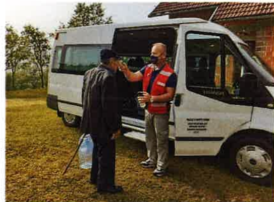
Korištenje usluge prijevoza – Projekt Mobilnost