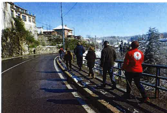
Nordijsko hodanje – Obilježavanje Svjetskog dana zdravlja

Rastokama. A u popodnevnim satima na nordijskom hodanju je ukupno sudjelovalo 5 osoba.