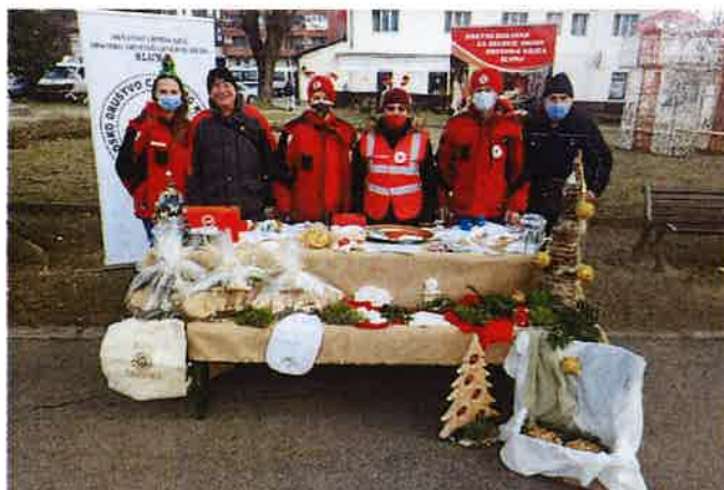
Božićni sajam 2021.