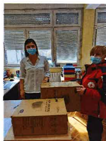
Podjela zaštitnih jednokratnih maski