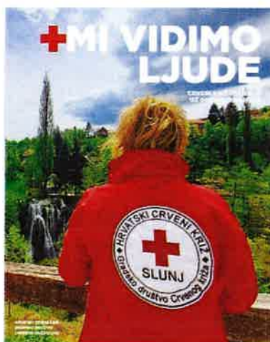
Katalog aktivnosti i usluga GDCK Slunj