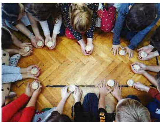
Radionica izrade Božićnjaka u školama