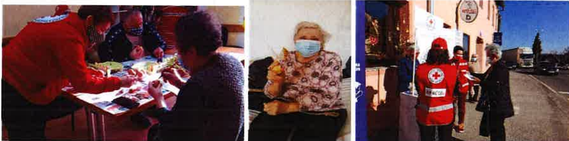
Izrada pisanice od gline i podjela građanima i korisnicima usluga Pomoć u kući i Zaželi-Oživi žene u zajednici