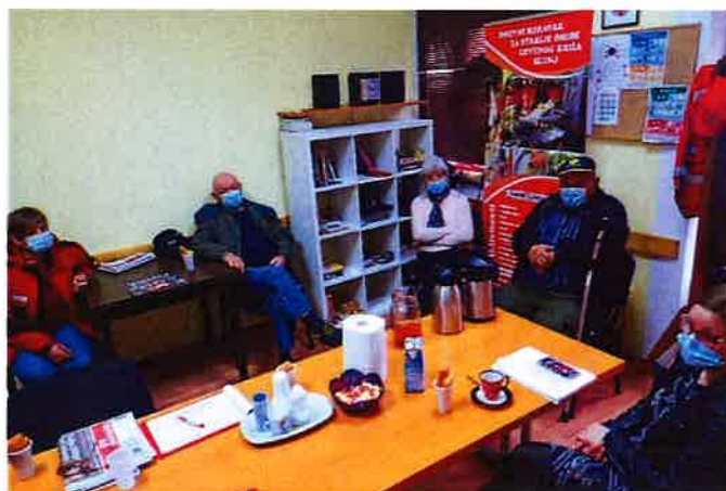
Predavanje o reciklaži otpada 28.04.21.