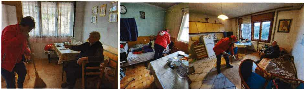
Žene ciljane skupine i krajnji korisnici projekta Zaželi – Oživi žene u zajednici