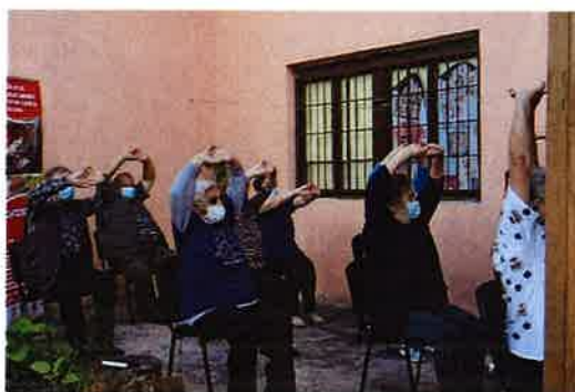
Predavanje i vježbe povodom Međunarodnog dana tjelesne aktivnosti